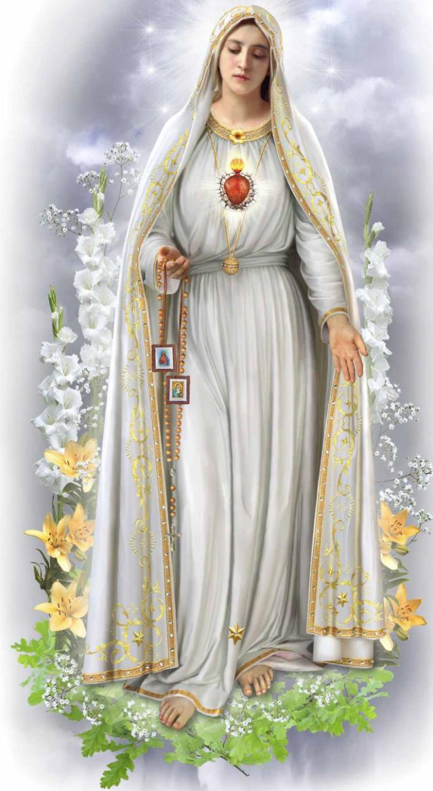
Akt Oddania Rodziny Niepokalanemu Sercu Maryi